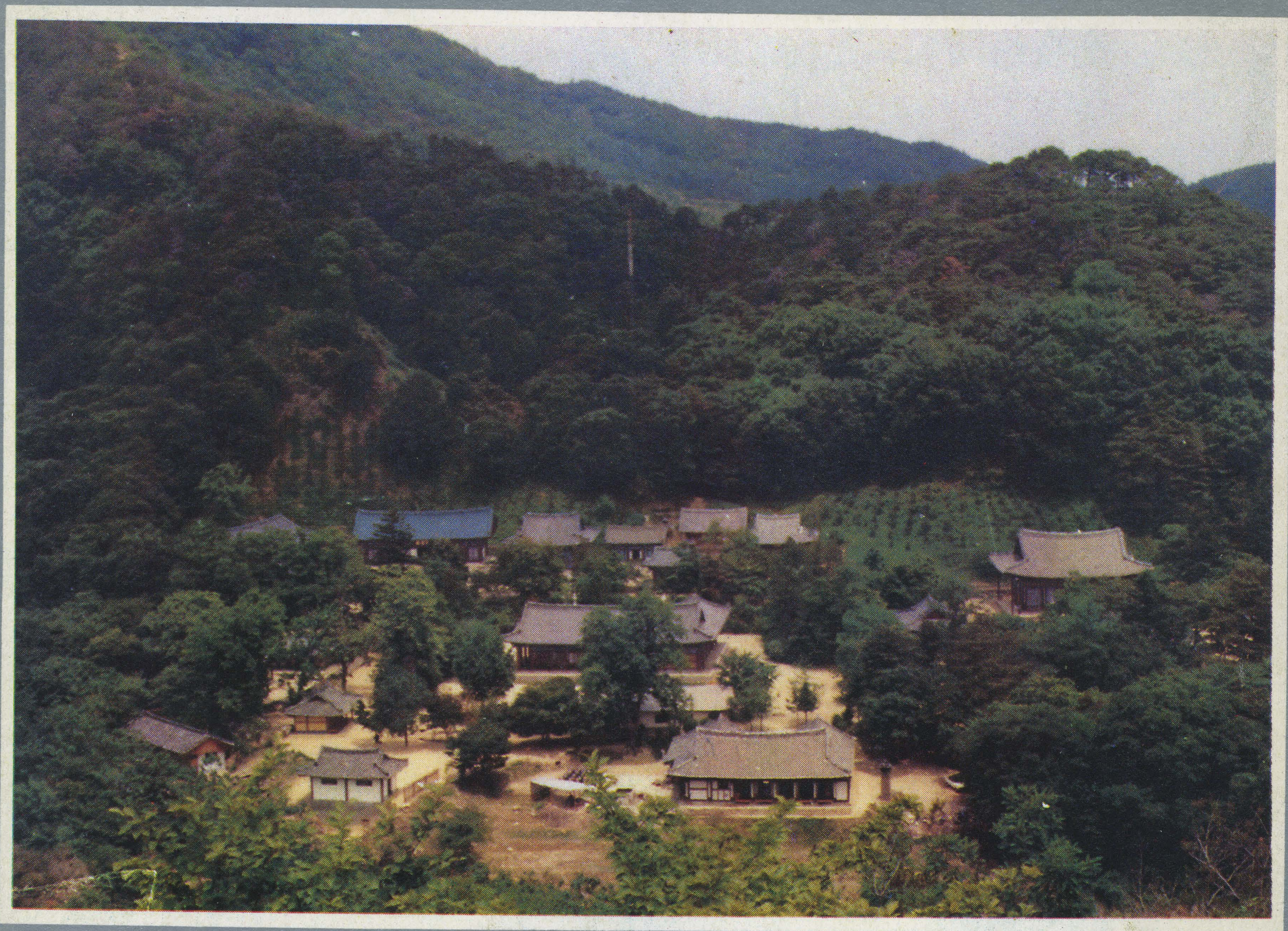
직 지 사 전 경