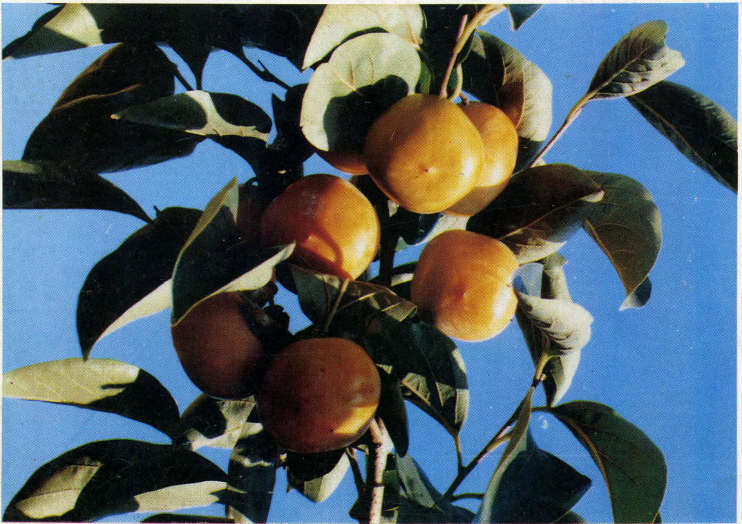
씨없고 당도 높은 “청도감”